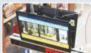
Пункт информирования и оповещения населения в здании с массовым пребыванием людей