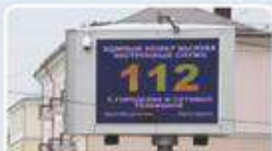
Пункт уличного информирования и оповещения населения