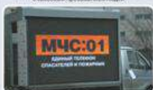
Мобильный комплекс информирования и оповещения населения